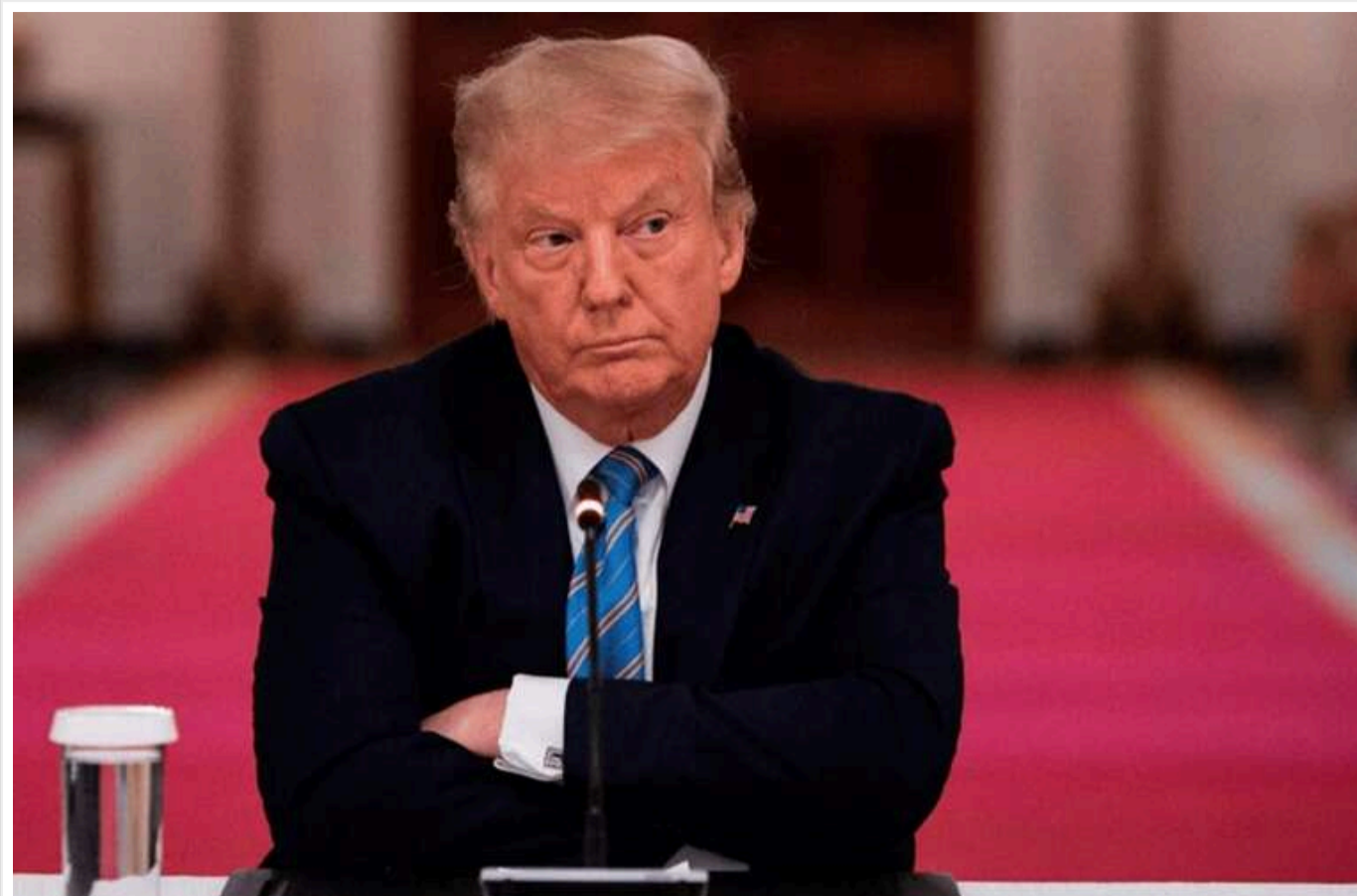
У США відклали розгляд справи проти Трампа про виплату порнозріці

Слухання у справі проти Трампа про виплату порноакторці відкладено, передає Reuters.