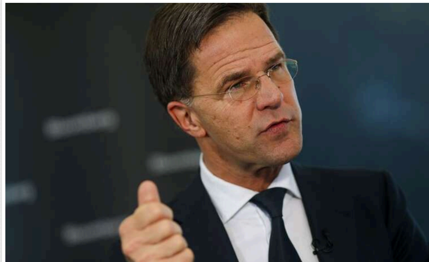
Генсек НАТО заявив, що партнерам України треба підтвердити свою прихильність до продовження війни

НАТО повинно надати Україні більше підтримки, щоб змінити хід конфлікту, підкреслив Генсек Альянсу.