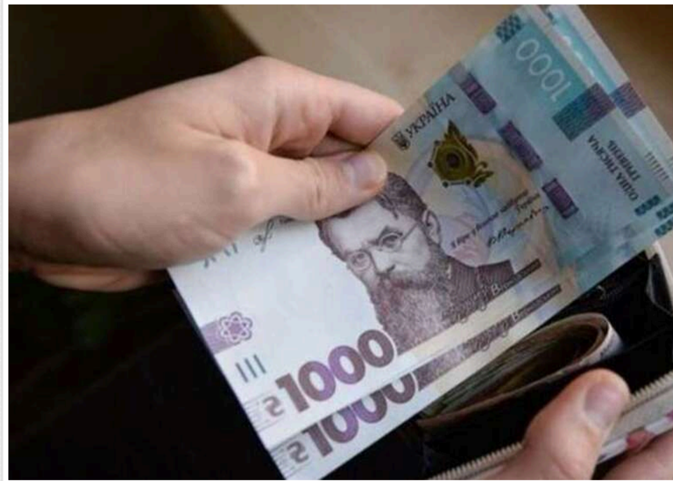
Уряд переніс реалізацію постанови про збільшення зарплат учителям на наступний рік після закінчення війни

Уряд уже вшосте відтермінував виконання постанови щодо підвищення мінімальної заробітної плати вчителів до чотирьох прожиткових мінімумів, яке було ухвалено в липні 2019 року.