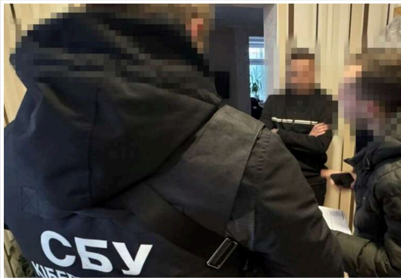
У Києві викрили колишню викладачку, яка закликала до підтримки Путіна та захоплення України

У Києві працівники СБУ викрили колишню викладачку іноземної мови, яка в соцмережах закликала до підтримки російського лідера Володимира Путіна. Також вона висловлювалася на користь захоплення України окупантами.