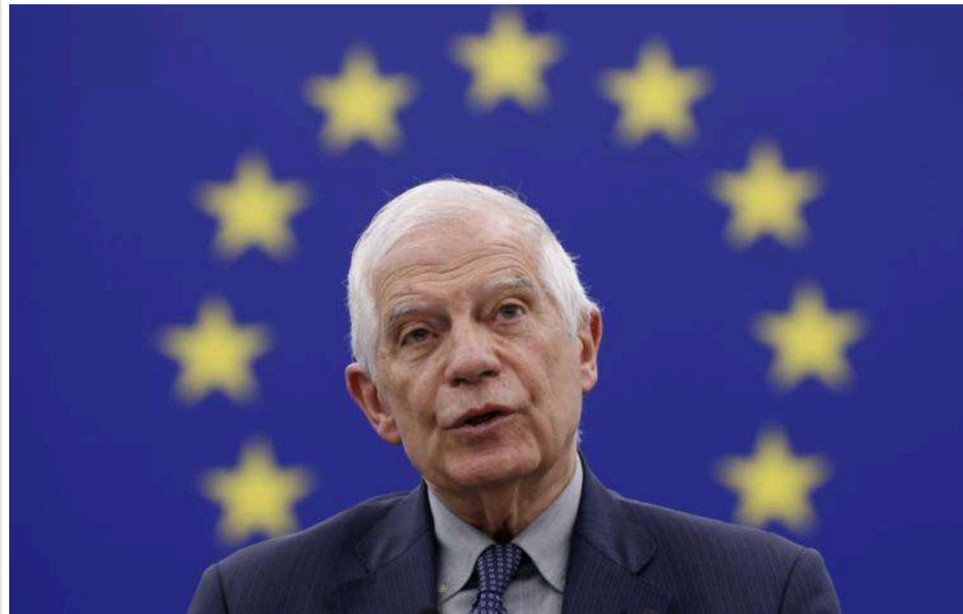
Боррель: ЄС після перемоги Трампа доведеться збільшити допомогу Україні

Європейській Союз має "обміркувати сценарій, за якого підтримка України" з боку Європи посилиться після перемоги Дональда Трампа на президентських виборах у США.