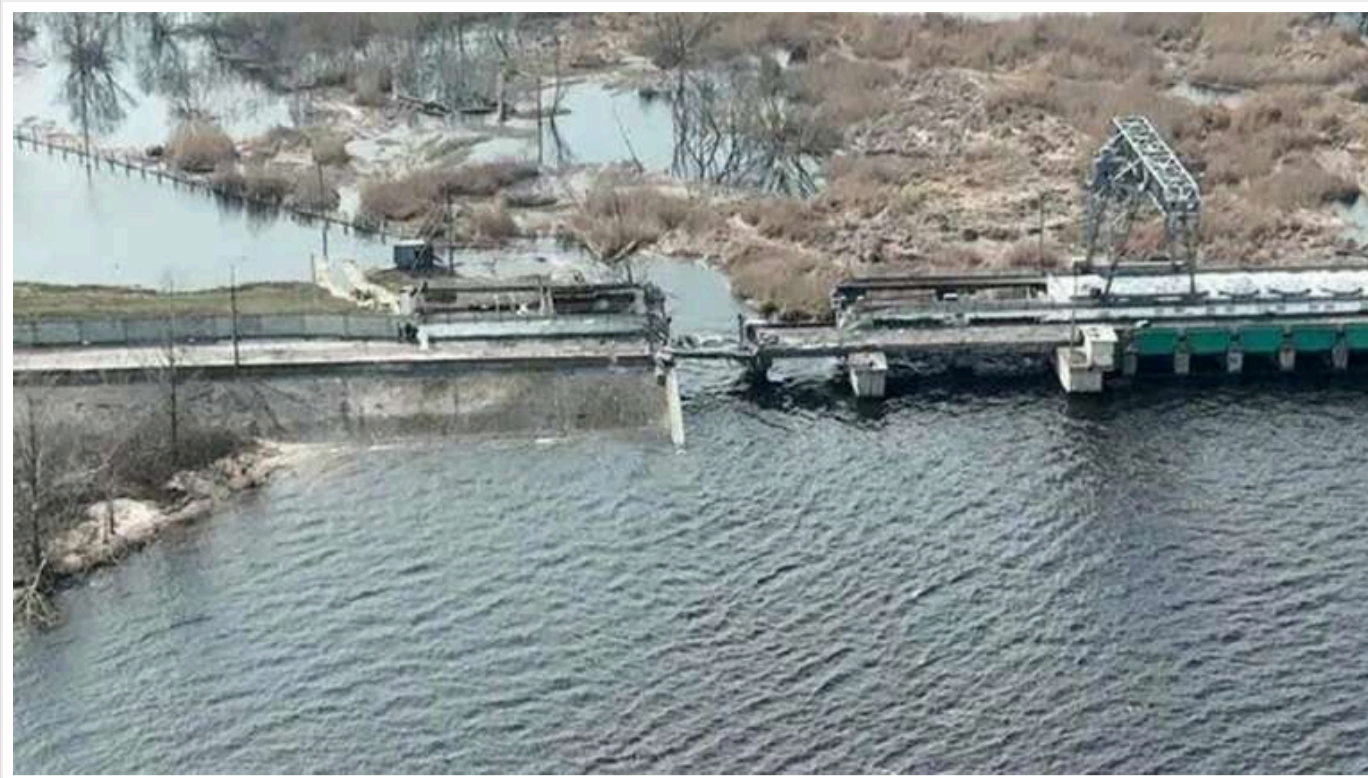
У МВА розповіли про ситуацію після підриву Курахівської дамби

На Курахівському водосховищі, де нижче від пошкодженої тернівської греблі прибуває вода, наразі не зафіксовано підтоплених будинків. При цьому через постійні російські обстріли оглянути гідротехнічну споруду поки що не вдалося.