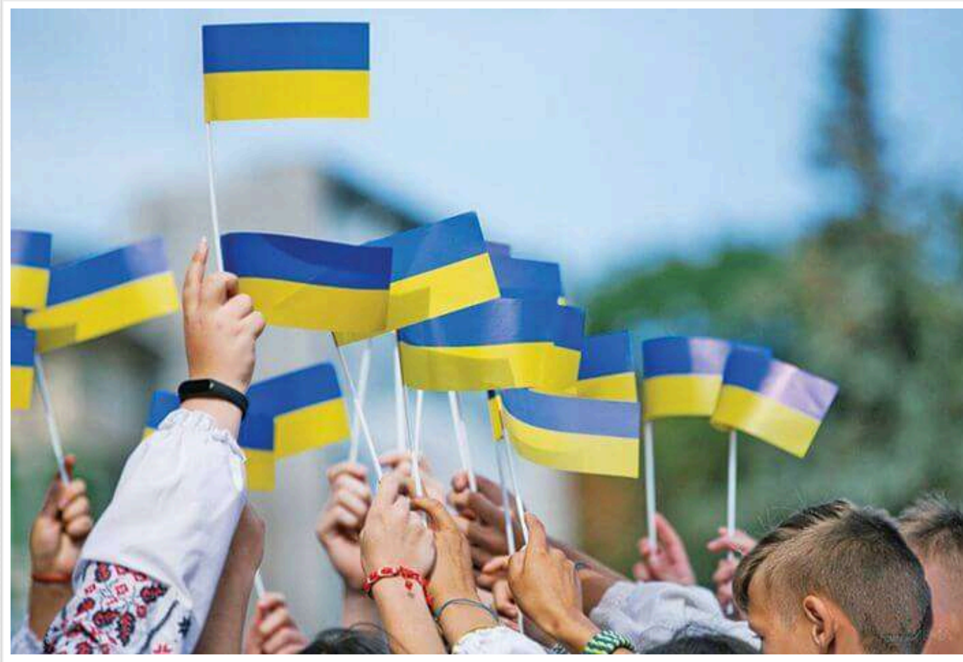
Менша частина українців погоджується на територіальні поступки Росії, - опитування

Станом на початок жовтня 2024 року 32% респондентів вважали, що для швидшого досягнення миру та збереження незалежності Україна може відмовитися від деяких своїх територій. Водночас більшість (58%) виступала проти будь-яких територіальних поступок Росії.