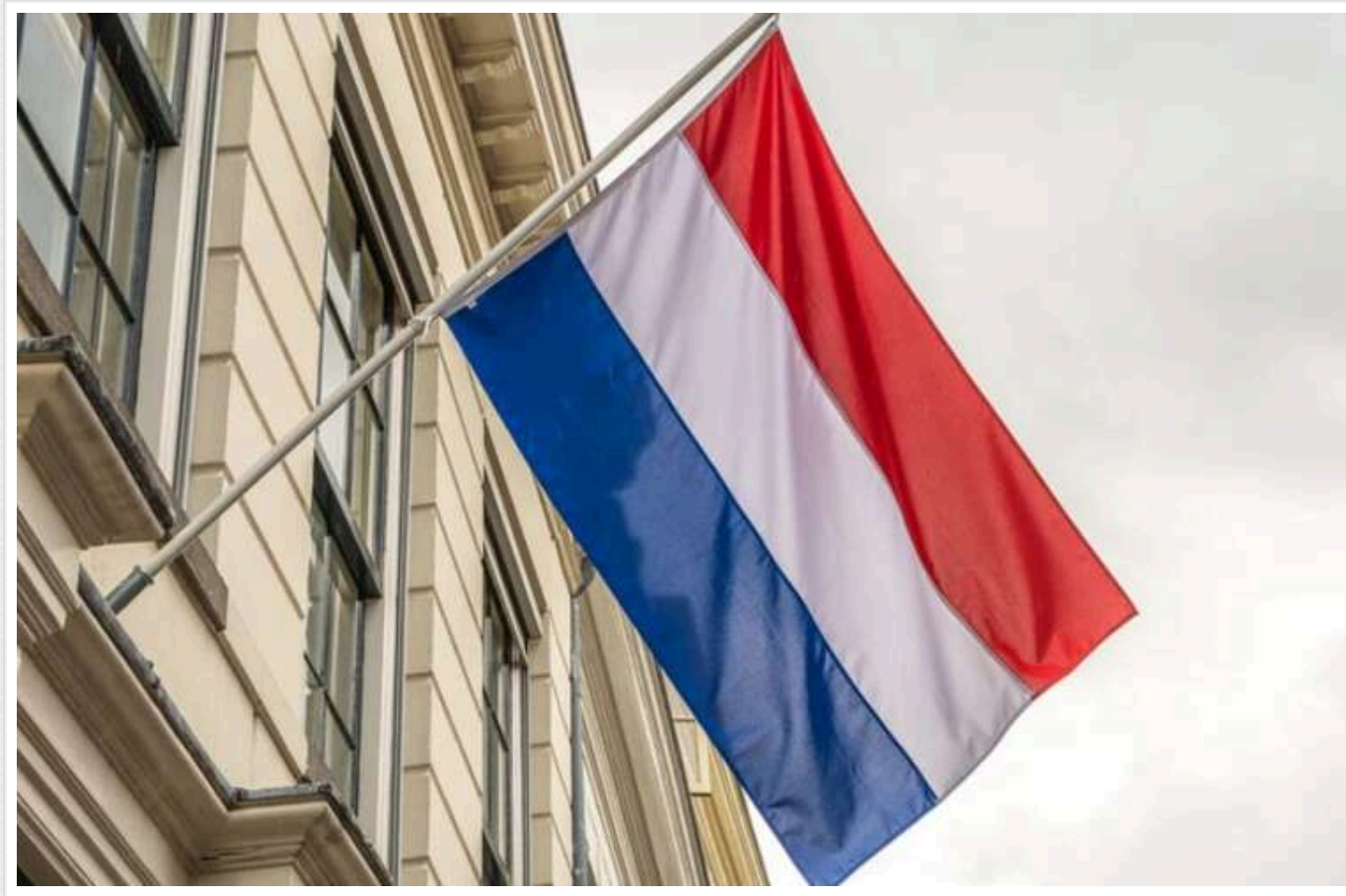
3 грудня Нідерланди запровадять контроль на кордонах

У Нідерландах тимчасово запроваджують контроль на кордонах для протидії нелегальній міграції. Рішення щодо додаткових перевірок на сухопутних кордонах із сусідніми державами набуде чинності 9 грудня.