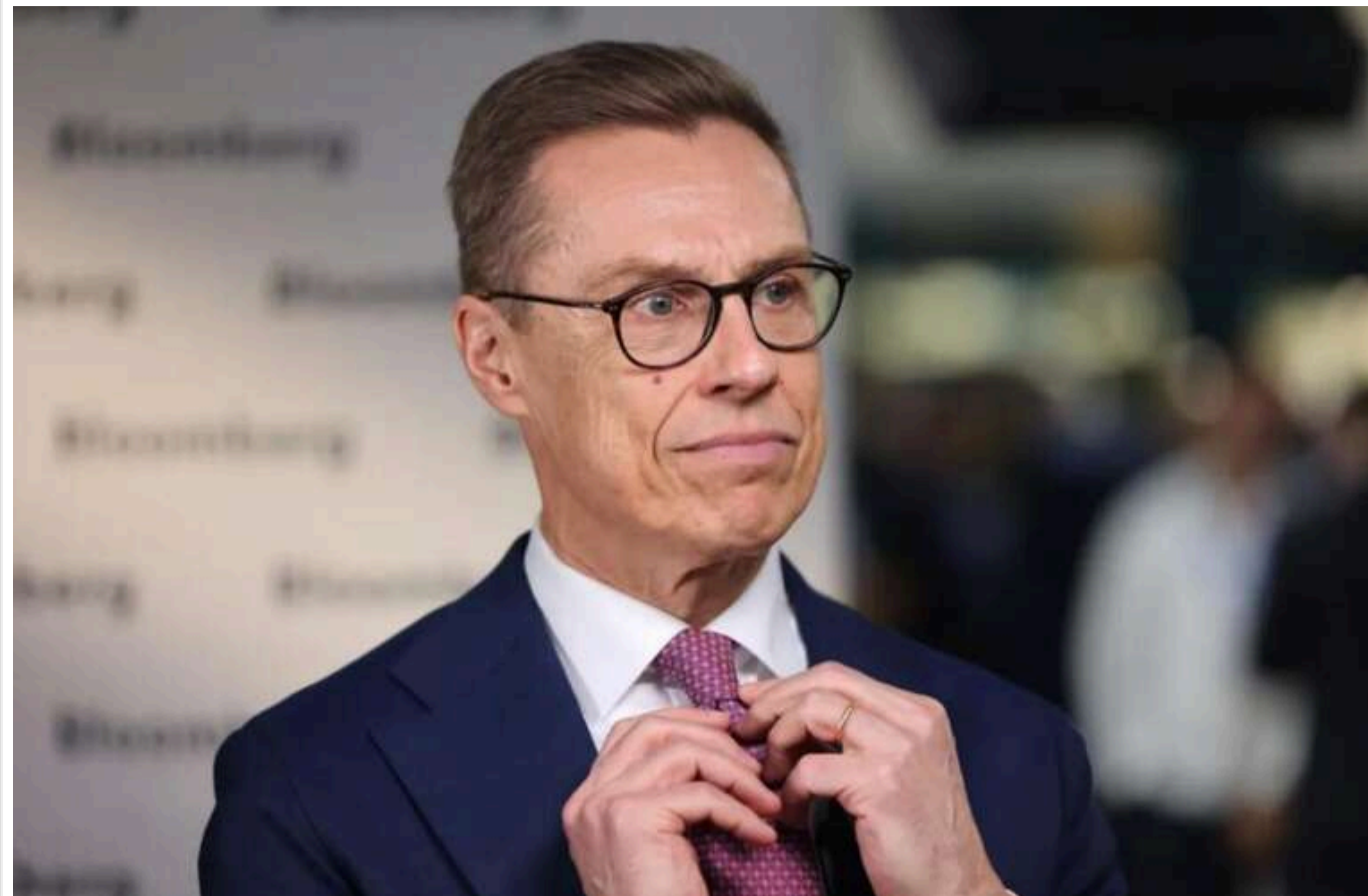
Трамп прагне якнайшвидшого укладення мирної угоди щодо України, - Александр Стубб

Про це Bloomberg повідомив президент Фінляндії після розмови з обраним лідером США.