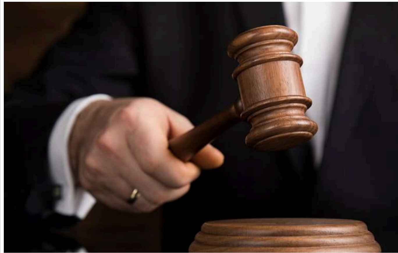
Експрацівник Нацбанку, який 10 років тому допустив крадіжку мішка золота, уник покарання

Приморський районний суд міста Одеси звільнив від кримінальної відповідальності колишнього співробітника Управління Нацбанку в Одеській області через закінчення строків давності.