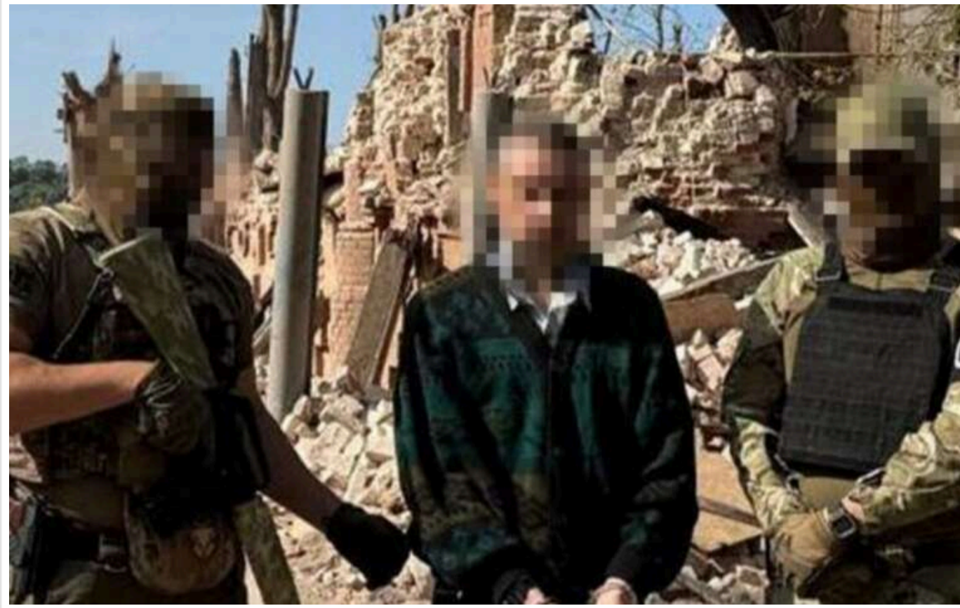
СБУ затримала агента ФСБ, який зливав позиції ВСУ в Куп'янську

У Харківській області затриманий ще один агент Федеральної служби безпеки (ФСБ). Зловмисник коригував ворожі удари по позиціях захисників Куп'янська.