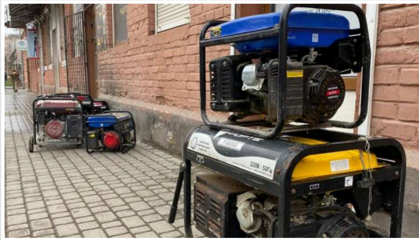
В Одесі комунальники терміново замовили генератори дорожче за ринкові ціни