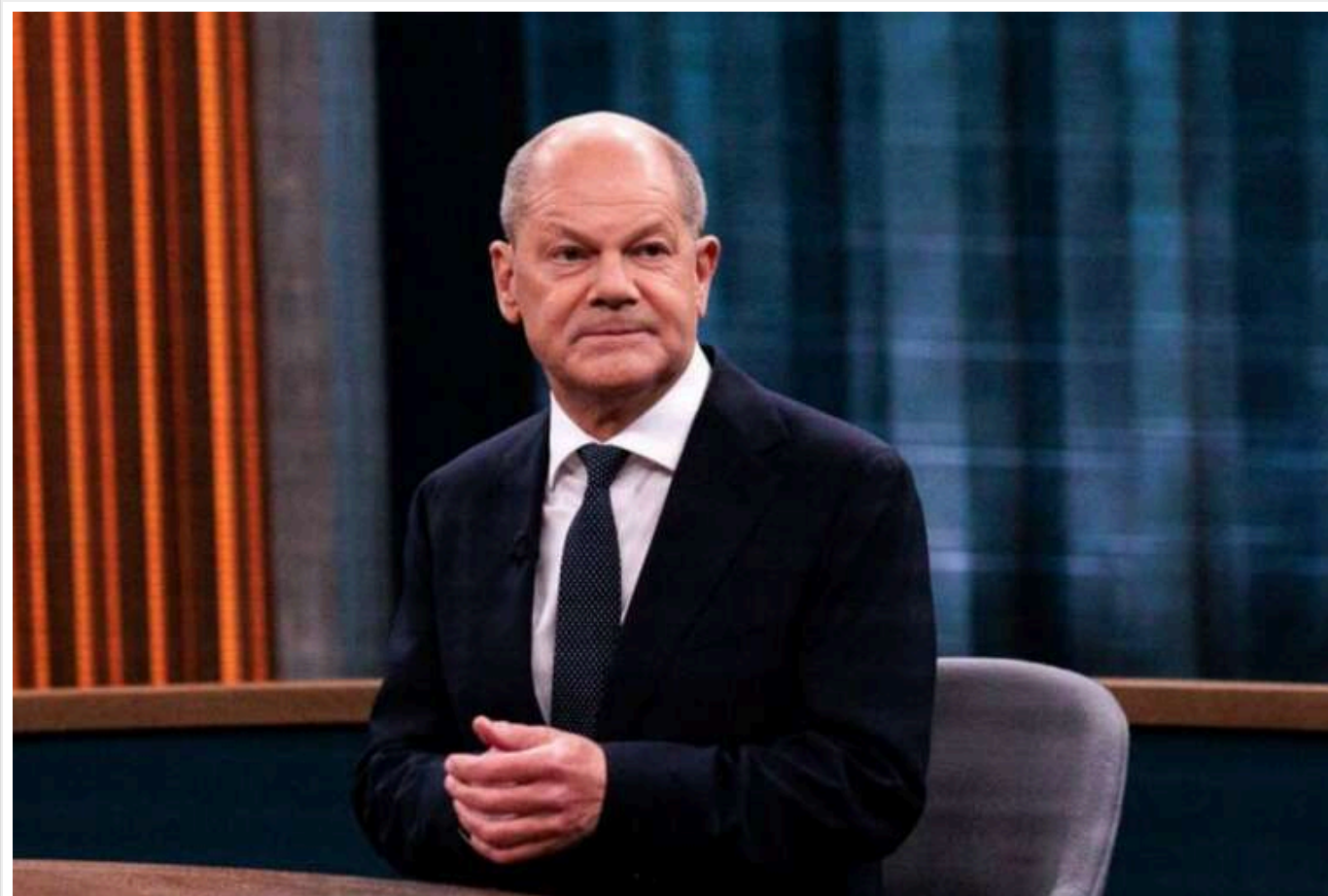
Ексміністр фінансів ФРН Лінднер планував використовувати кошти, призначені для виплати пенсій німцям, для надання допомоги Україні

Про це повідомив канцлер Німеччини Олаф Шольц в інтерв'ю на телеканалі ARD.