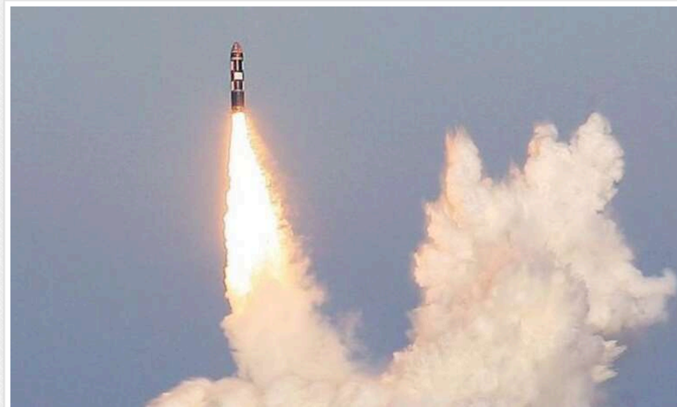
У РФ ведеться підготовка ядерної ракети Р-30 "Булава"

У мережі з'явився супутниковий знімок, на якому видно процес підготовки та спорядження міжконтинентальної балістичної ракети Р-30 "Булава". Вона є частиною "ядерної тріади" Росії та розміщується на атомних підводних крейсерах проекту 955 "Борей".