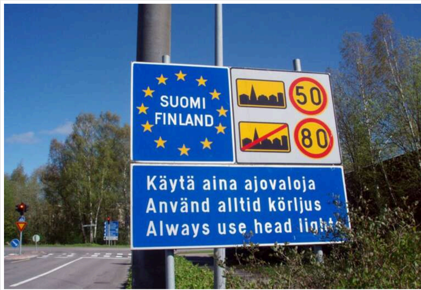
Фінляндія наприкінці лютого 2025 року дозволить в'їзд громадянам Росії

Міжнародні консультації між державами вже розпочалися.