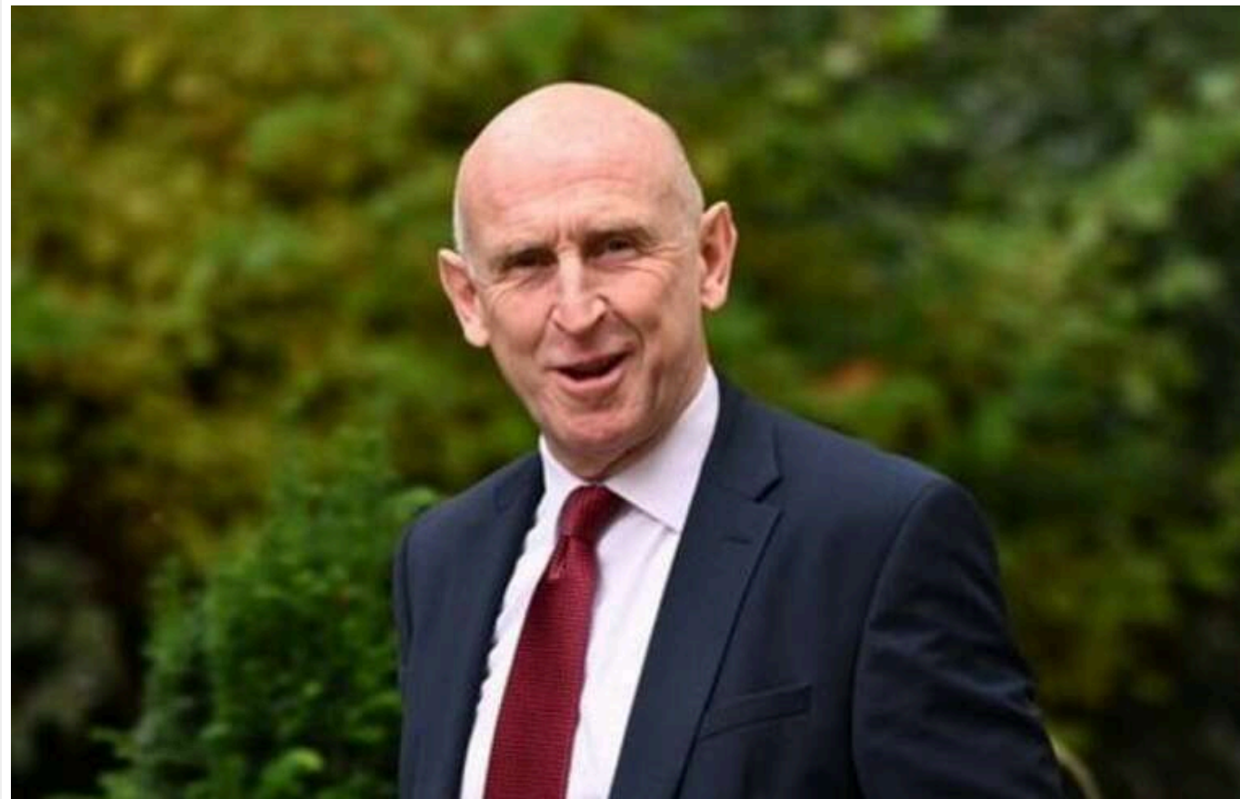
Це хороший знак для України, - Глі про можливий дзвінок Трампа Путіну

Ймовірна розмова Дональда Трампа з російським диктатором Володимиром Путіним є позитивним сигналом для України. Такий дзвінок може свідчити про те, що Вашингтон продовжуватиме підтримувати українців.