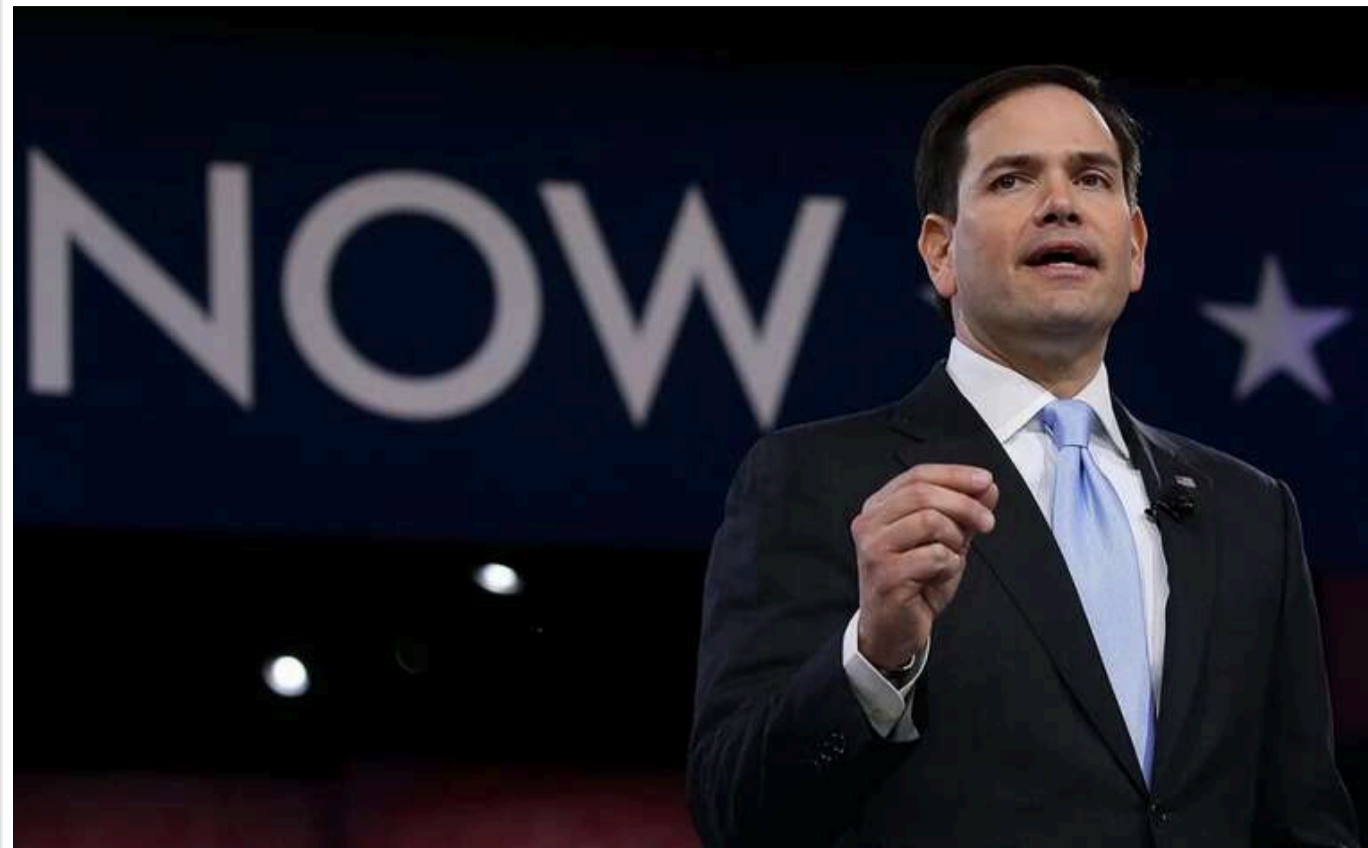
Трамп може призначити на посаду держсекретаря сенатора Рубіо, - NYT

Під час формування нового кабінету Дональд Трамп розглядає кандидатуру сенатора Марко Рубіо на посаду керівника зовнішньополітичного відомства США - Державного департаменту.