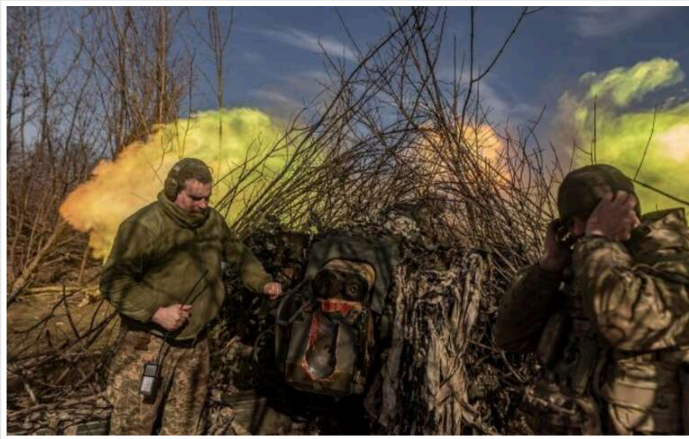
РФ збирає резерви в районі Часового Яру та на Сіверському напрямку, - ОТУ "Луганськ"

У районі Часового Яру та на Сіверському напрямку російські війська концентрують сили та акумулюють резерви. Ймовірно, кількість активних боїв і атак на цих напрямках незабаром відновиться.