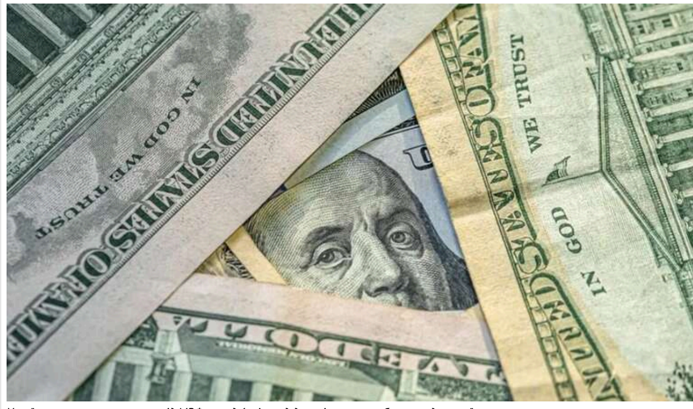
Україна має шанс отримати від МВФ понад 1 мільярд доларів у рамках безпрецедентної програми

До Києва прибула місія Міжнародного валютного фонду (МВФ) задля обговорення з українською владою шостого перегляду програми Механізму розширеного фінансування (EFF). Аби отримати 1,1 млрд доларів траншу, Україна має забезпечити чотири основні вимоги, що стосуються бюджетного планування, фінансової стабільності, енергетики та державного управління.