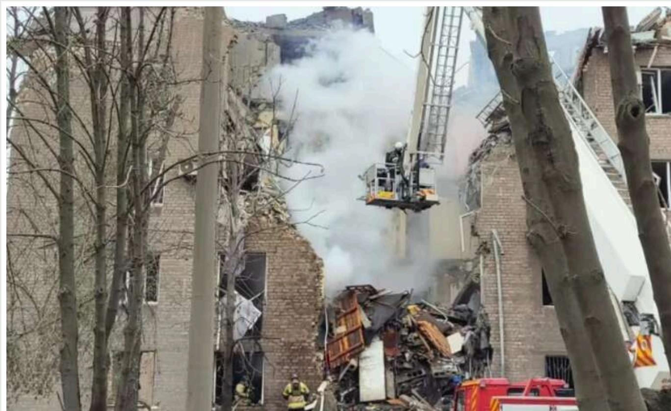
У Кривому Розі з-під завалів дістали тіло жінки, під уламками можуть залишатися ще троє дітей

У Кривому Розі рятувальники дістали тіло жінки з-під руїн багатоповерхівки, що постраждала від ракетного удару.