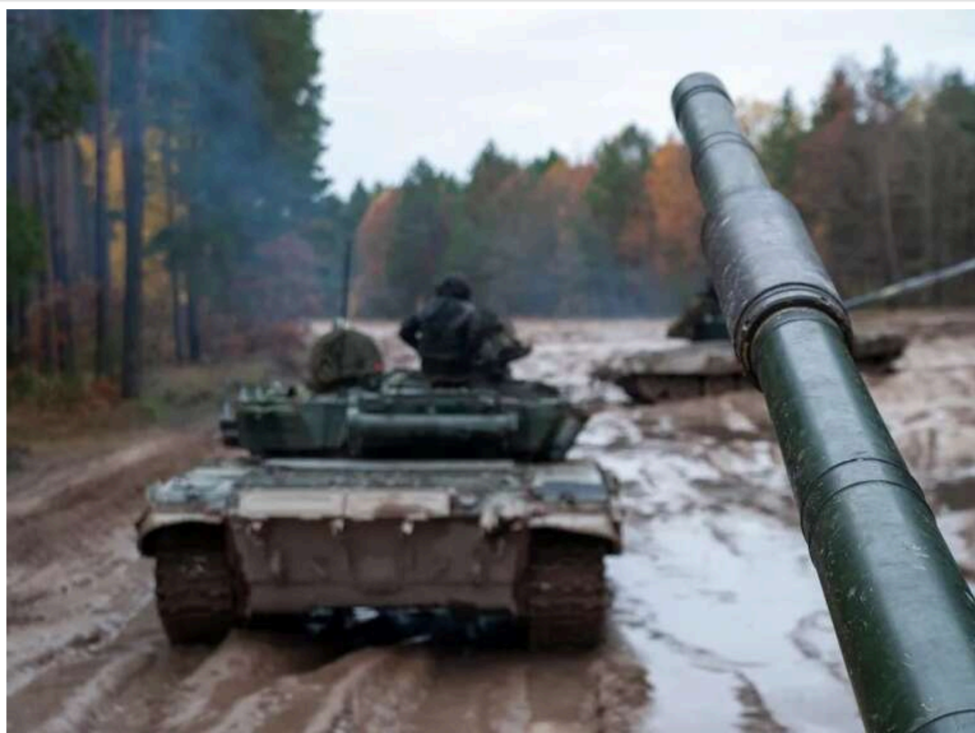
Ситуація на фронті: Найгарячіше на Покровському та Курахівському напрямках

Протягом минулої доби українські військові зіткнулися з численними атаками російських військ. На фронті було зафіксовано 160 бойових зіткнень.