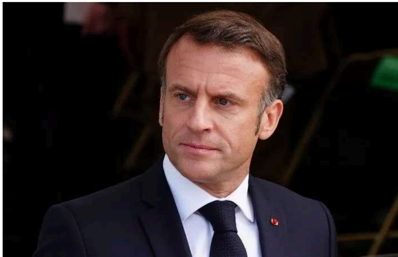
Макрон планує відвідати футбольний матч "високого ризику" між Францією та Ізраїлем

Футбольний матч "високого ризику" між збірними Франції та Ізраїлю на стадіоні "Стад де Франс" відбудеться цього четверга, 14 листопада. Його відвідає президент Франції Еммануель Макрон.