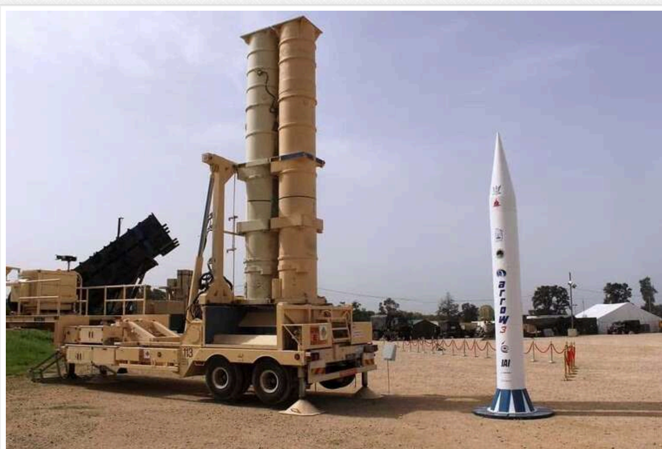
У Німеччині розгорнуть ізраїльську систему ППО Arrow 3

У 2025 році в Німеччині розмістять ізраїльську систему протиракетної оборони Arrow 3. Ця система розроблена для перехоплення балістичних ракет великої дальності ще до того, як вони потраплять в атмосферу Землі.