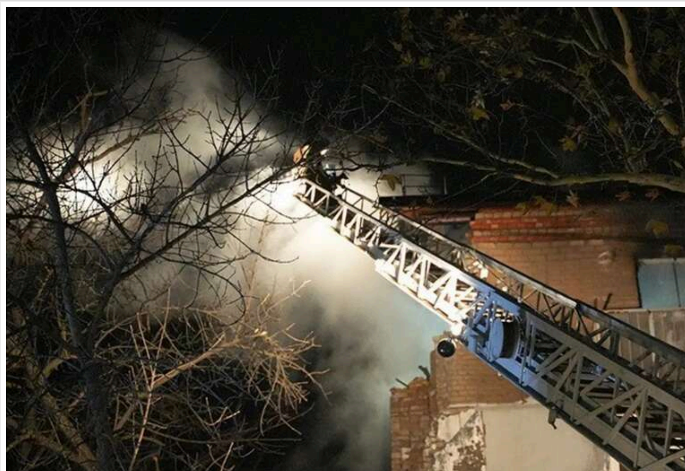
Окупанти завдали ударів "шахедами" по Миколаєву: влучили в житлову забудову, є загиблі

У ніч на понеділок, 11 листопада, російські війська здійснили атаку на Миколаїв ударними безпілотниками "Шахед". Внаслідок ворожого обстрілу в житловій зоні виникли пошкодження та загинули п'ятеро осіб.