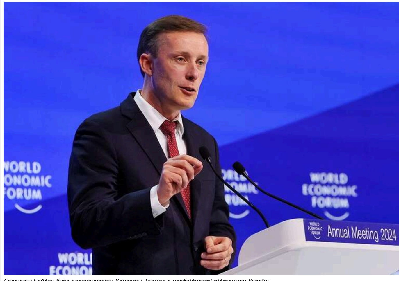
Салліван: Байден буде переконувати Конгрес і Трампа в необхідності підтримки України

Чинний президент США Джо Байден до завершення своєї каденції наголошуватиме на необхідності підтримки України на тлі перемоги на виборах Дональда Трампа.