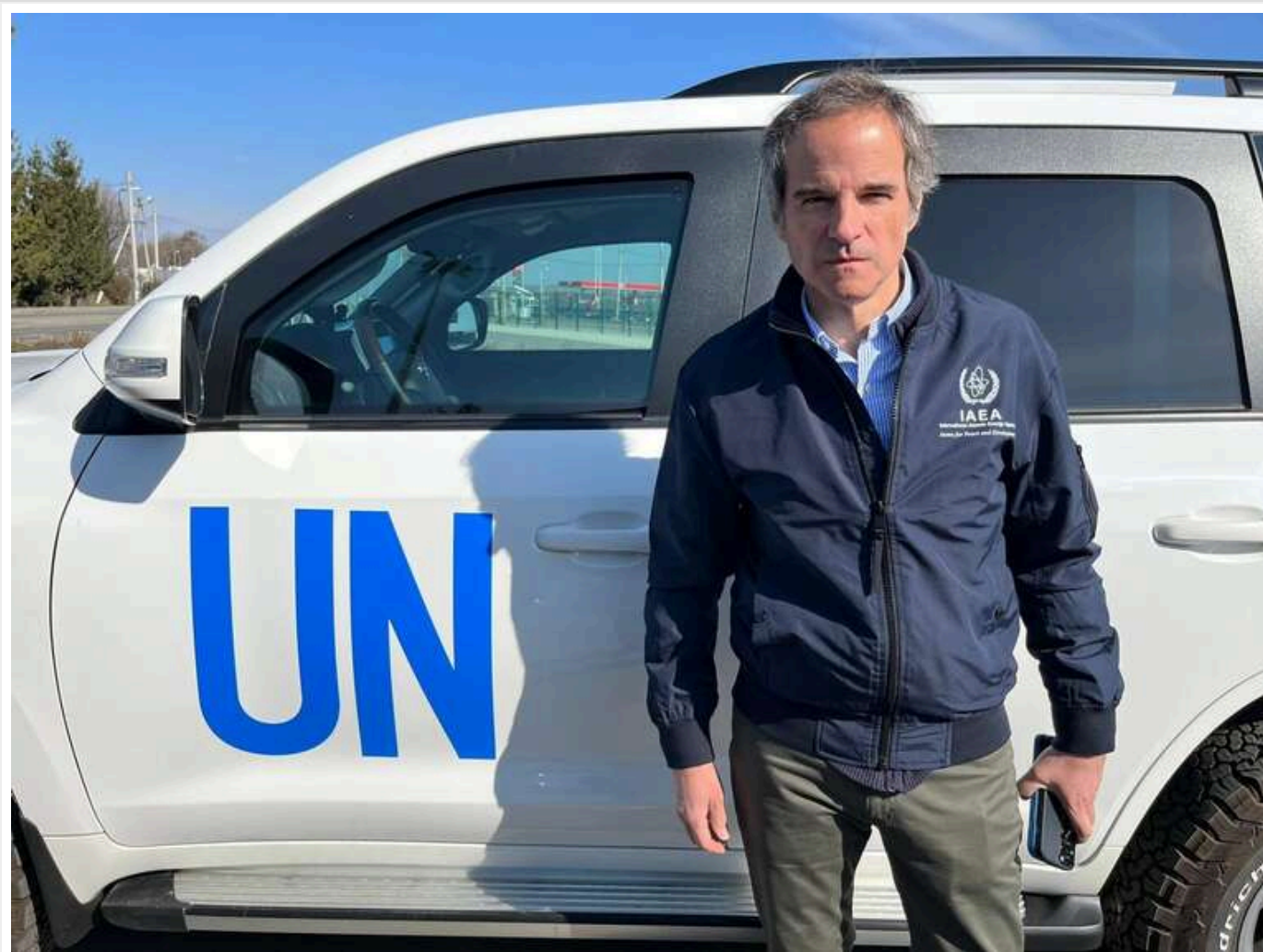
Голова МАГАТЕ планує поїздку в Тегеран

Генеральний директор Міжнародного агентства з атомної енергії (МАГАТЕ) Рафаель Гроссі вирушить до Тегерана. У столиці Ірану в нього заплановано зустрічі з представниками уряду країни та "технічні обговорення" стосовно спільних заяв.