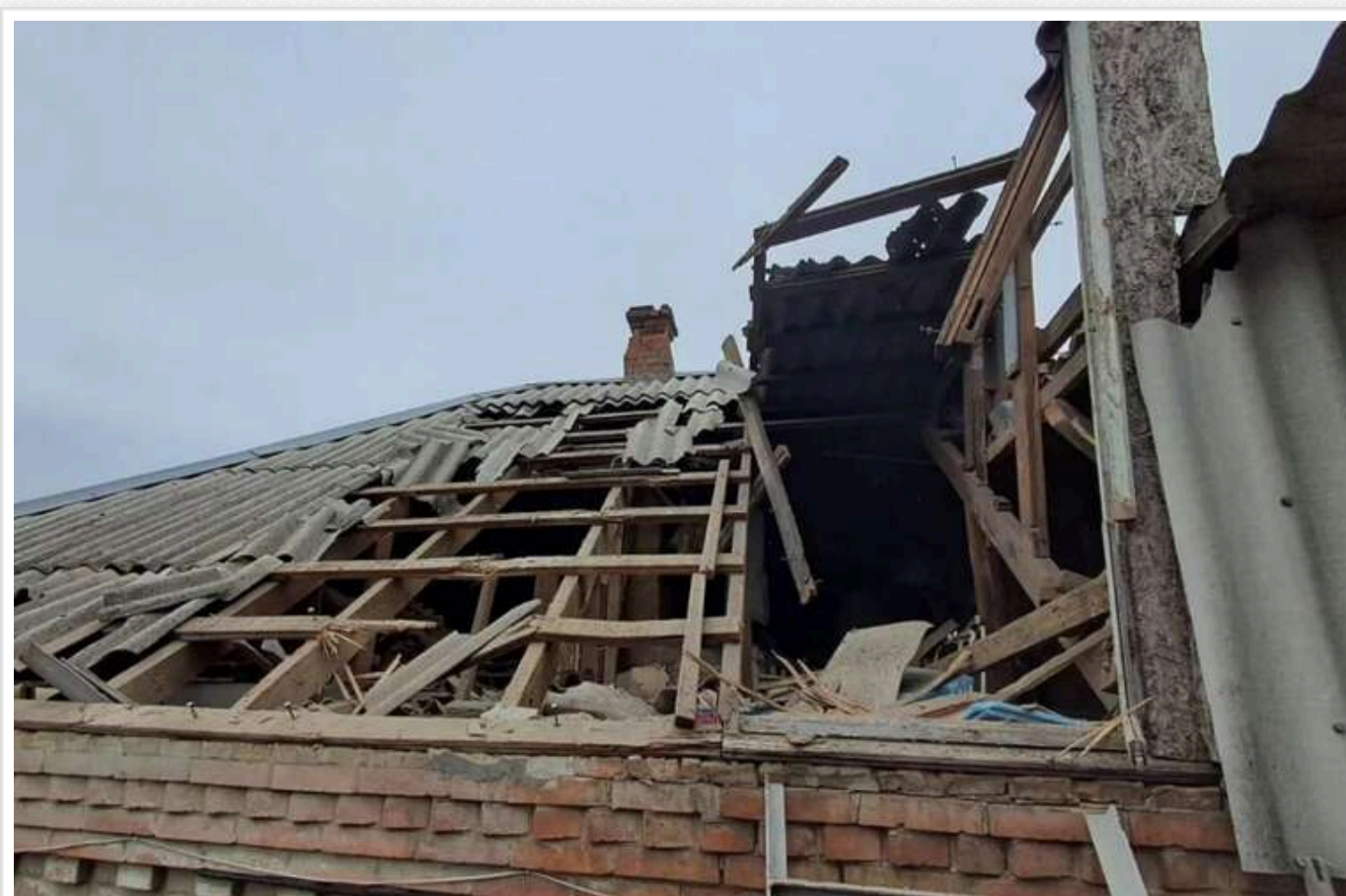
Окупанти продовжують тероризувати Нікопольщину: потрощили будинки, авто, ЛЕП

Країна-терористка не зупиняє атаки на Україну з тимчасово окупованих земель. Протягом нещодавніх 10 листопада, росіяни тероризували Нікопольщину на Дніпропетровщині.