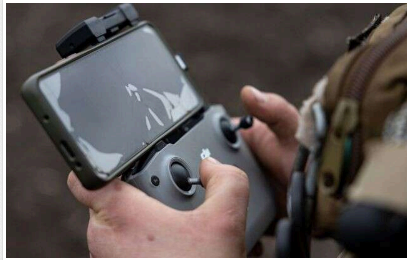
На Донеччині 2 російських піхотинці потрапили під стрілецький вогонь українських воїнів

У селі Терни на Донеччині російські піхотинці потрапили під обстріл з боку українських захисників. Операторів дронів 96-го батальйону 60-ї окремої механізованої Інгулецької бригади допомогли ліквідувати загарбників.