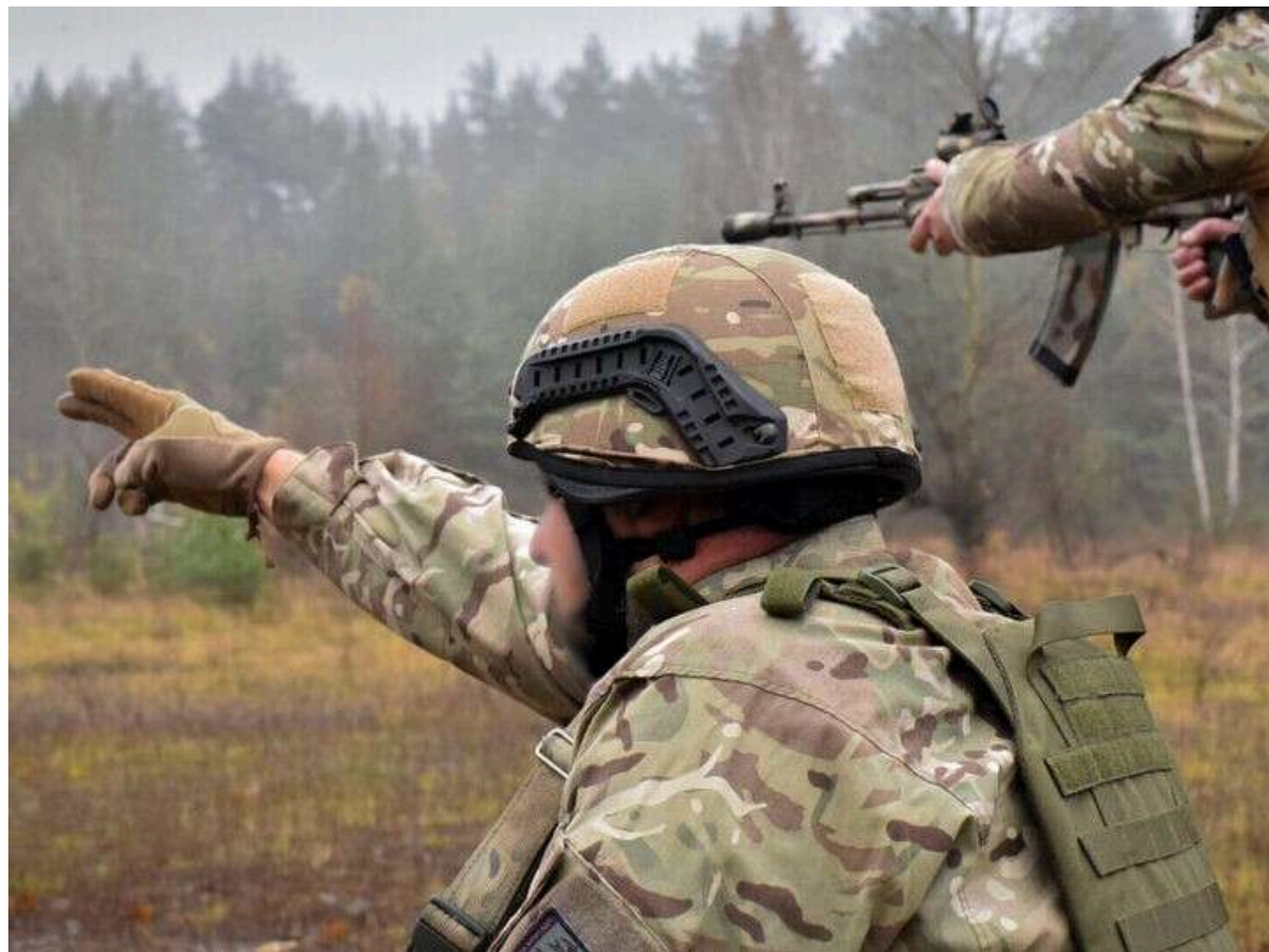
Ситуація на фронті: Ворог активно атакує на Курахівському, Покровському та Времіївському напрямках

З початку доби на фронті відбулося 108 бойових зіткнень. Наші захисники зупиняють ворога, утримують рубежі та руйнують ворожі плани.