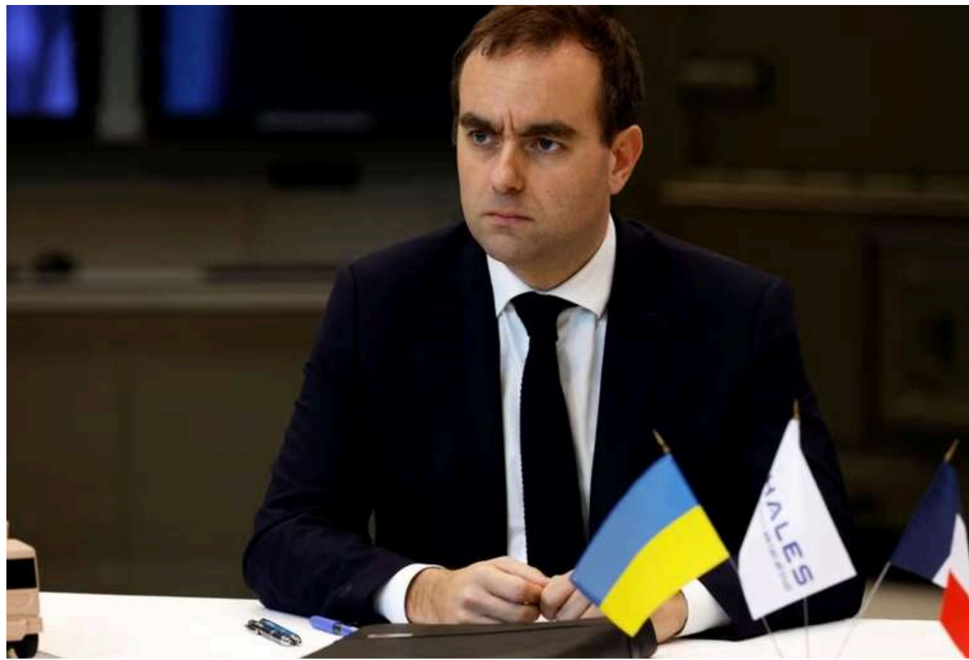
У Франції прокоментували чутки про скорочення Трампом інвестицій в НАТО

Фінансування НАТО залежить від рішення новообраного президента США Дональда Трампа. Однак, Європа повинна самостійно піклуватися про свою безпеку.