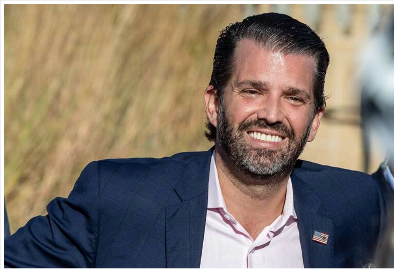
Дональд Трамп-молодший опублікував мем про Зеленського: "38 днів до втрати допомоги"

Син Трампа заявив, що Зеленський «втратить свою допомогу», коли його батько стане президентом.