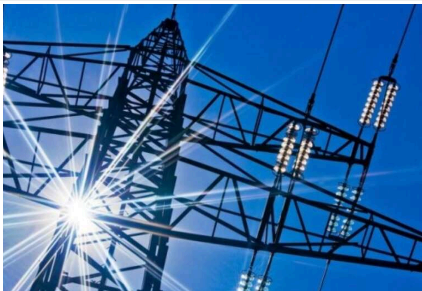
Україна має намір протягом доби закупити електроенергію в п'яти країн

Енергетична система України залишається стабільною, однак пошкодження інфраструктури ускладнюють її роботу. На сьогодні прогнозується імпорт у загальному обсязі 1000 МВт/год із потужністю 301 МВт.