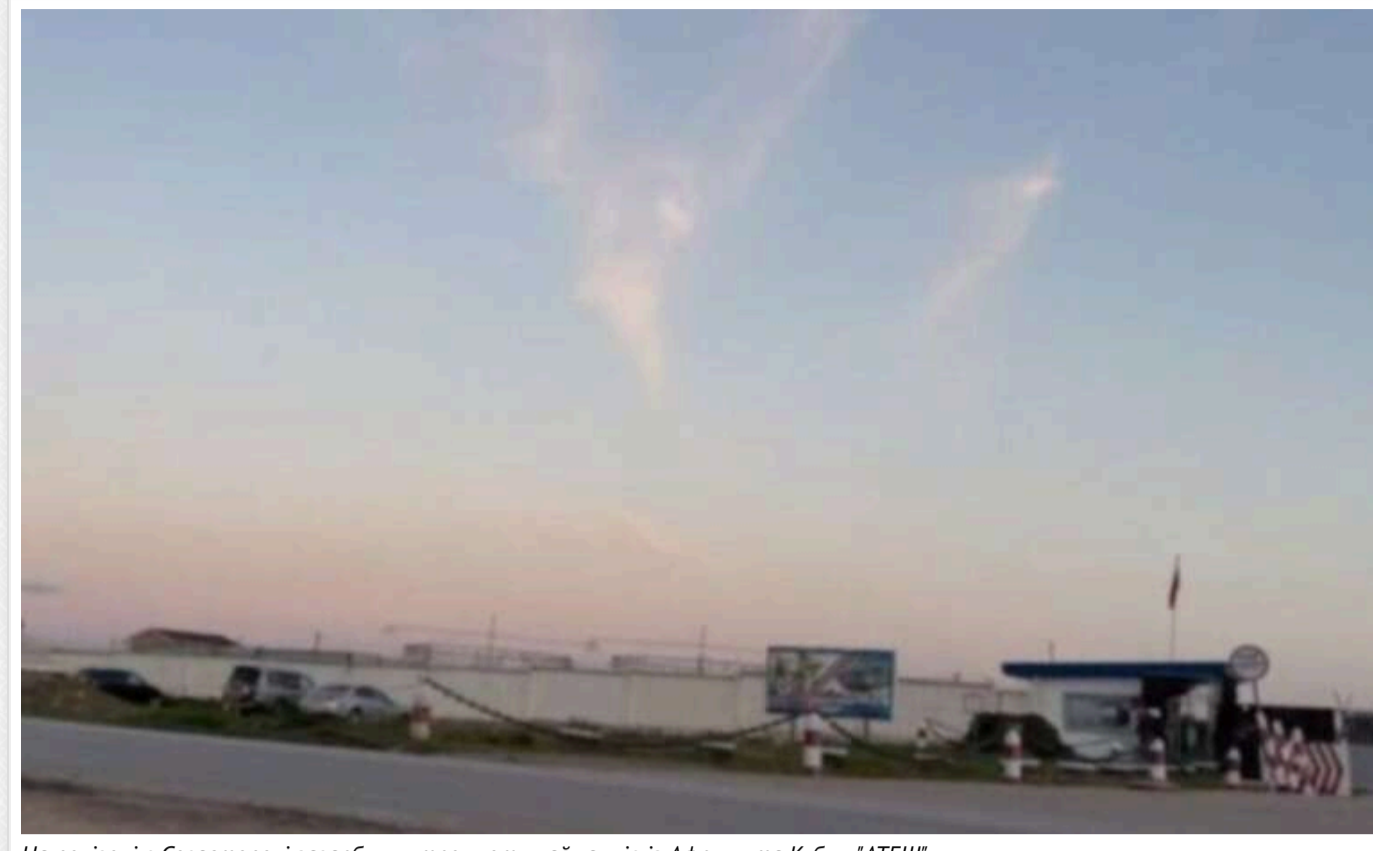
На полігоні в Севастополі загарбники тренують найманців із Африки та Куби, - "АТЕШ"

На полігоні "Казачий" у Севастополі військові з Росії навчають найманців із африканських країн та Куби.