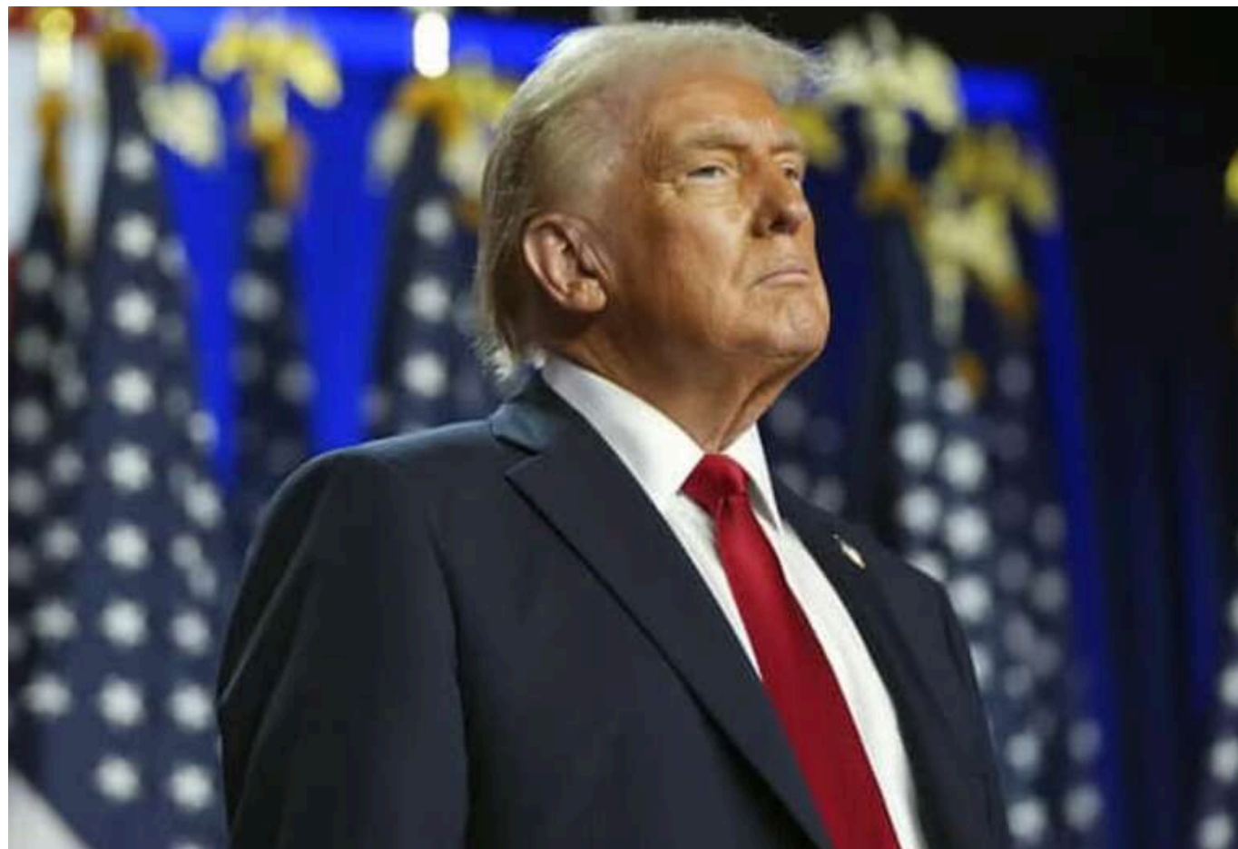
В адміністрації Трампа відхрестились від заяв радника, який закликав Україну "забути про Крим"

У перехідній адміністрації Дональда Трампа повідомили, що радник кампанії обраного президента США Браян Ланза не висловлювався від його імені, закликаючи Україну "забути про Крим" як необхідну умову для мирного врегулювання.