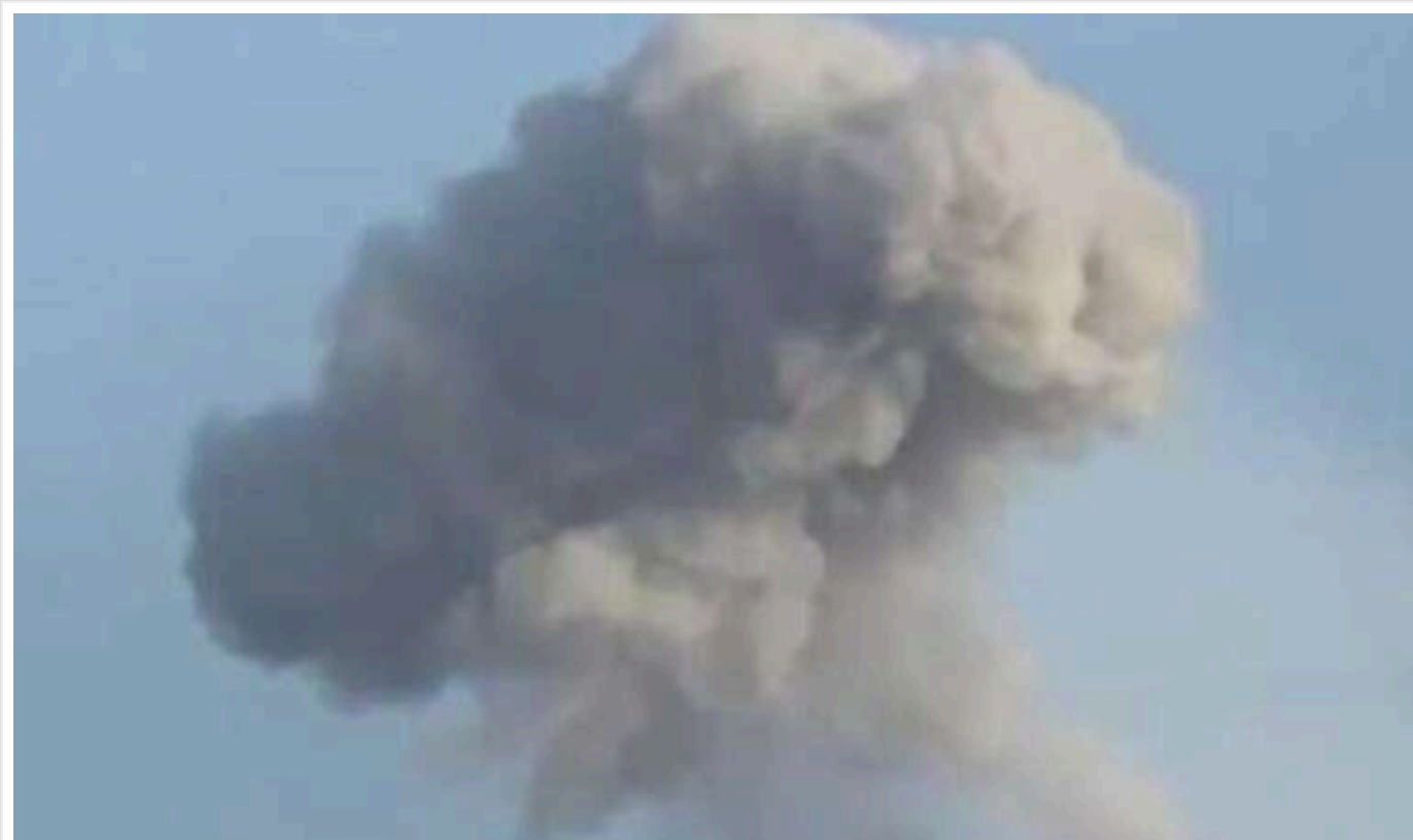
Вночі та вранці росіяни 36 разів відкривали вогонь по прикордонних територіях Сумщини: є поранений

Вночі та зранку росіяни здійснили 36 обстрілів прикордонних районів та населених пунктів Сумської області. Загалом зафіксовано 69 вибухів. Постраждали Сумська, Бездрицька, Хотінська, Юнаківська, Краснопільська, Миропільська, Білопільська, Великописарівська, Шалигинська, Дружбівська, Свеська, Середино-Будська громади , - зазначено у повідомленні.