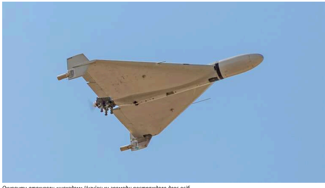
Окупанти атакували «шахедом» Чугуївську громаду: постраждало двоє осіб

Російські війська здійснили атаку ударним дронем типу Shahed на Чугуївську громаду Харківської області – постраждали двоє людей.