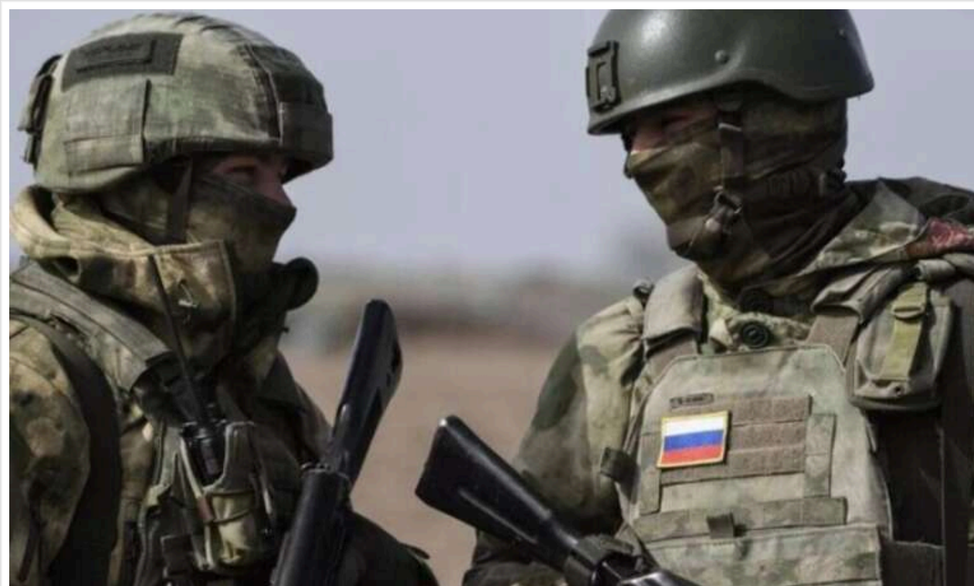
Війська РФ знаходяться в селі Сонцівка і намагаються обійти Курахове із західної сторони, - DeepState

Вони вже у центрі цього населеного пункту, повідомляє паблік, спираючись на відео стрільби з боку ЗСУ по будівлях у центрі Сонцовки. DS стверджує, що противник концентрує свої сили в селі.