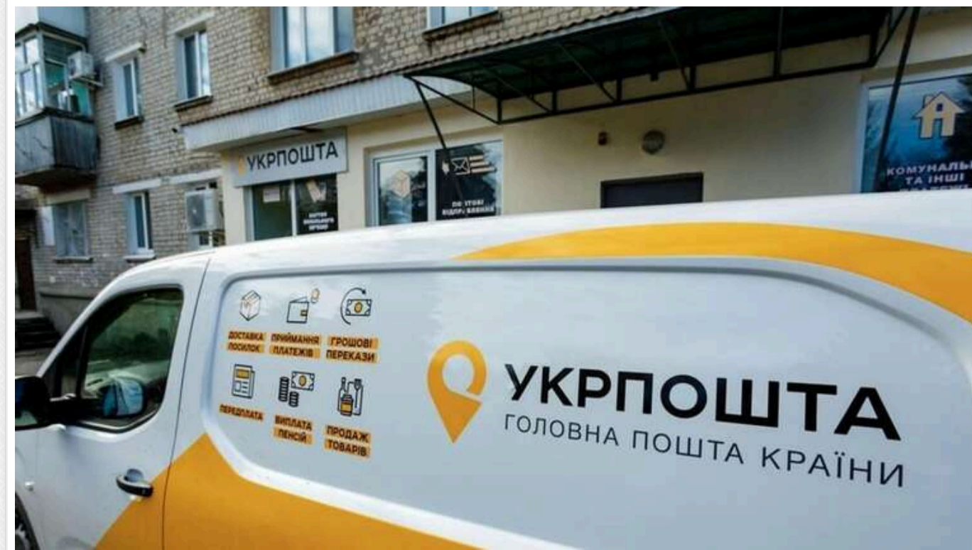
У Куп'янській громаді Харківської області зачинилося останнє відділення "Укрпошти"

У Куп'янській громаді Харківської області через російські обстріли припинило роботу останнє відділення "Укрпошти" та закрилися банкомати.