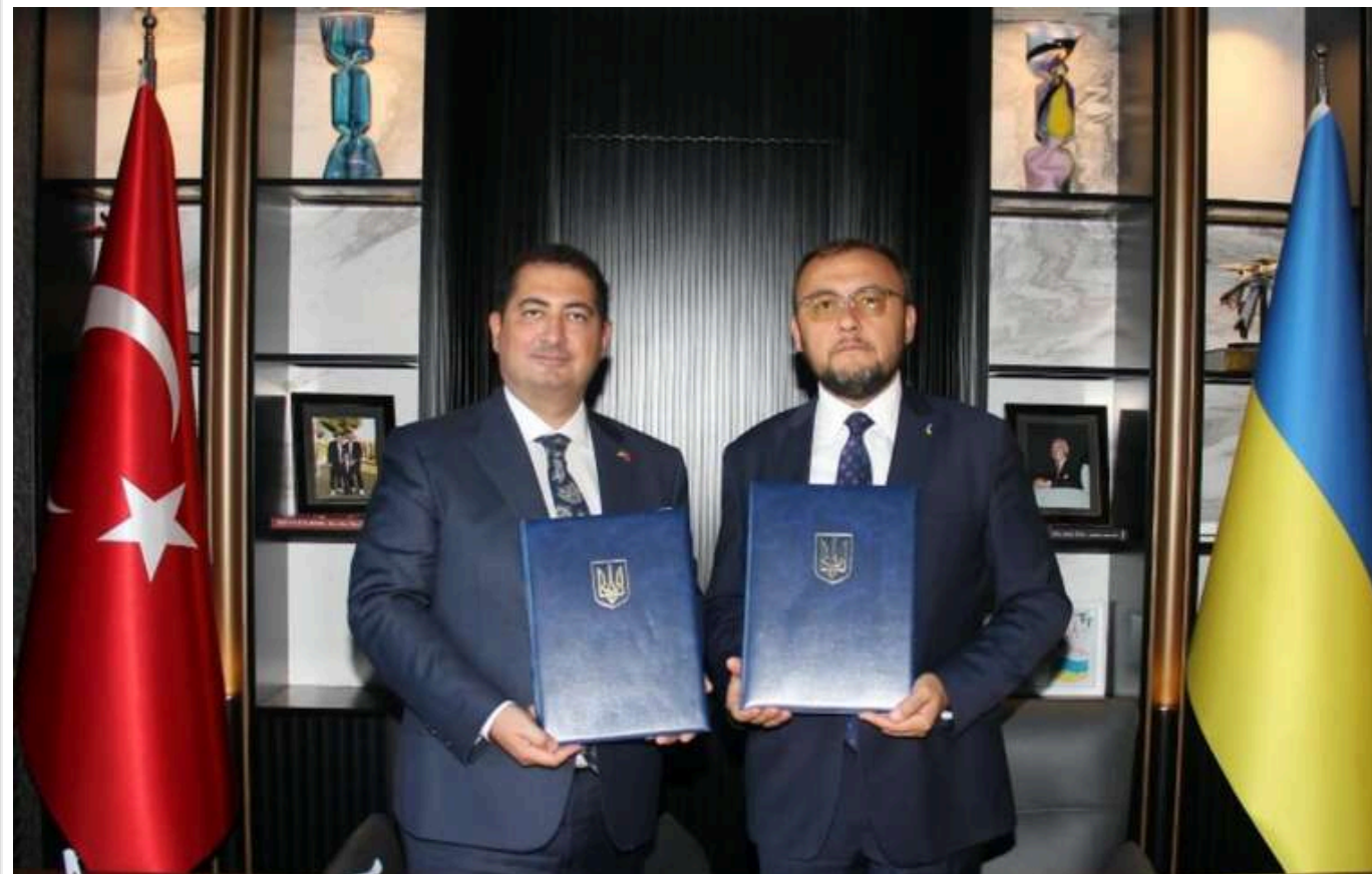
У Туреччині почало працювати нове почесне консульство України

У місті Адана, Туреччина, відкрилося нове почесне консульство України. Його очоливі бізнесмен і активіст, який активно підтримує боротьбу України проти російської агресії.