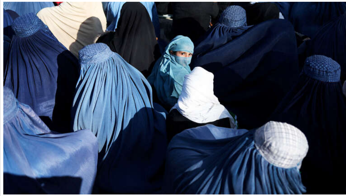
The Telegraph: іракська влада планує зменшити «вік згоди» для дівчаток із 18 до 9 років

Іракський парламент розглядає поправку до закону про особистий статус, яка знижує «вік згоди» для дівчат з 18 до 9 років.