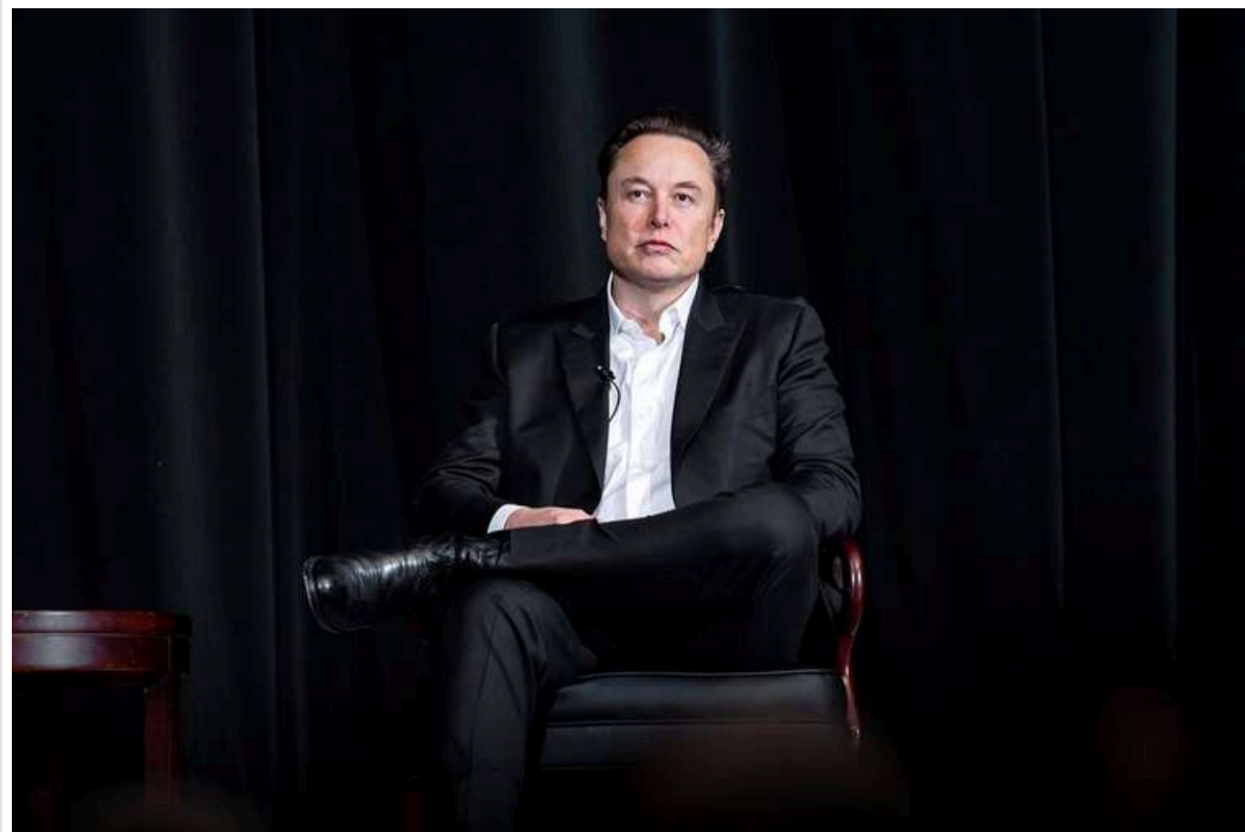
Після обрання Трампа статки Ілона Маска вперше за два роки перевищили позначку в 300 мільярдів доларів

За оцінками журналу Forbes, Маск у п'ятницю мав 304 мільярди доларів.