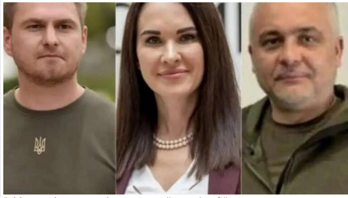
Кандидати на посаду генпрокурора згадувалися в антикорупційних матеріалах - ЗМІ

Згідно з інформацією від джерел в Офісі президента та Офісі генерального прокурора, видання "Факти" визначило трьох основних кандидатів, які наразі розглядаються на вакантну посаду генерального прокурора. Усі вони мають неоднозначну репутацію та фігурували у журналістських антикорупційних розслідуваннях.