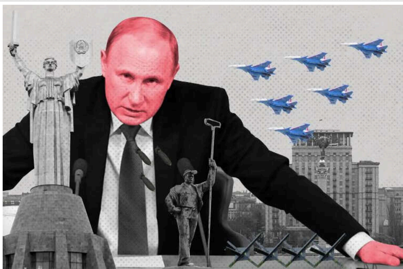
The Economist: Росія на фоні повернення Трампа готує нову хвилю атак на енергосистему України та планує ліквідацію її керівництва

Росія вже поступово відновлює свою кампанію зі знищення енергетичної інфраструктури. Ці атаки посилюватимуться, але, крім цього, в небезпеці може перебувати й безпосереднє вище керівництво України, заявляє міністр закордонних справ 2019-2020 років, посол у Британії, Канаді та НАТО Вадим Пристайко.