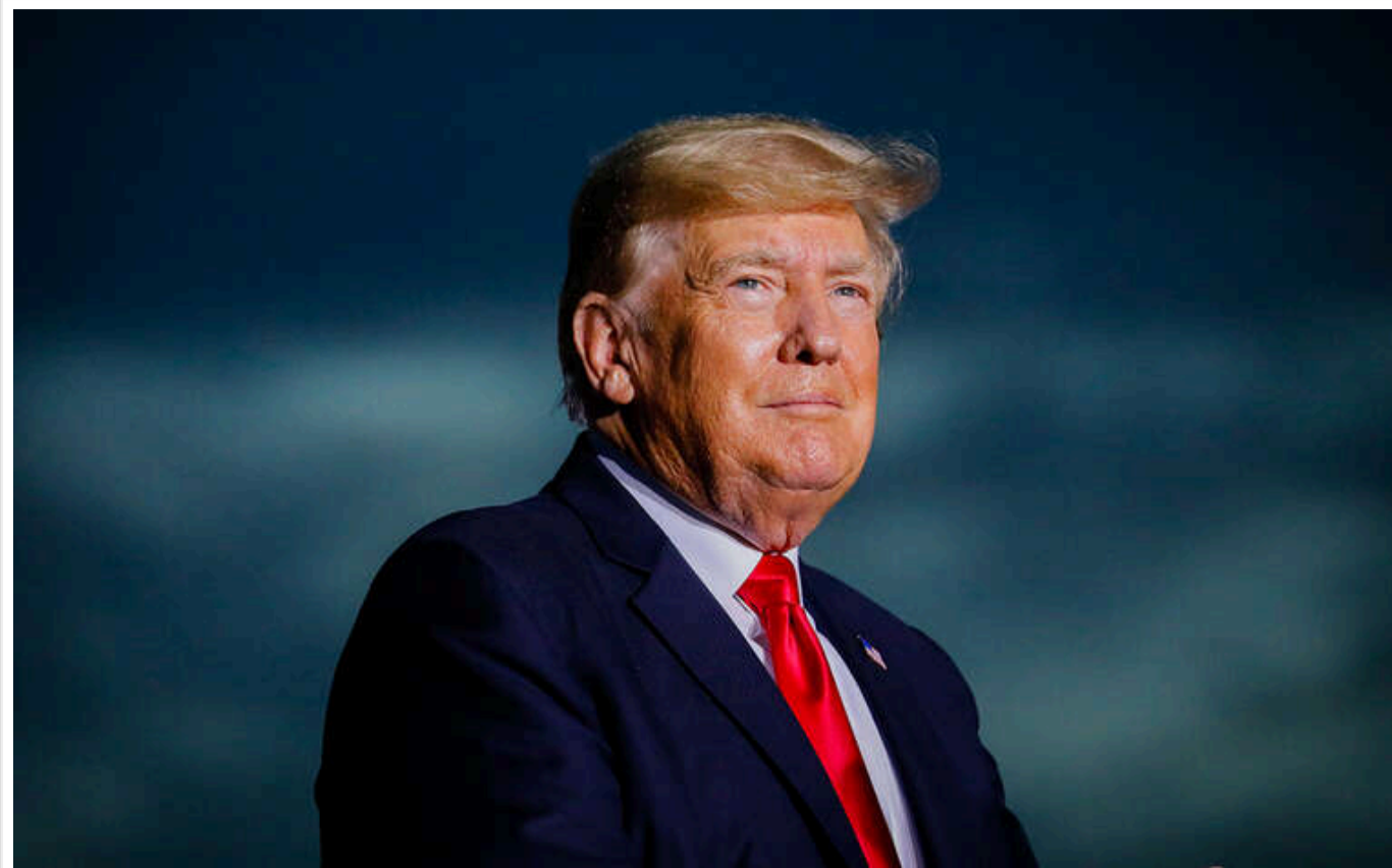
Очікуємо хвилю чуток про "мирні плани" до інавгурації Трампа, - ЦПД

В найближчі місяці у світових ЗМІ може з'явитися багато інсайдів про різні "мирні плани". Це пов'язано з переобранням Дональда Трампа на пост президента США.