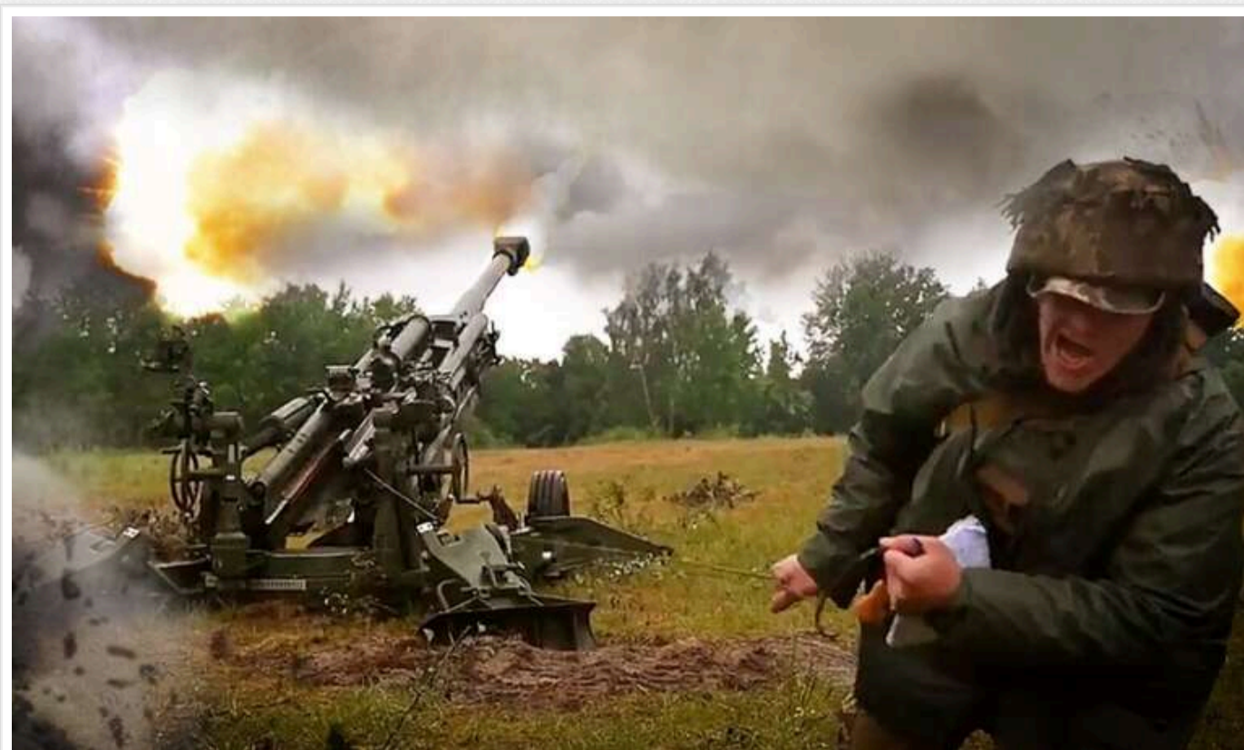
На Курахівському напрямку ЗСУ знаходяться під ударом ствольної артилерії РФ

Українські телеграм-канали публікують карту DeepState по ситуації на Курахівському напрямку.