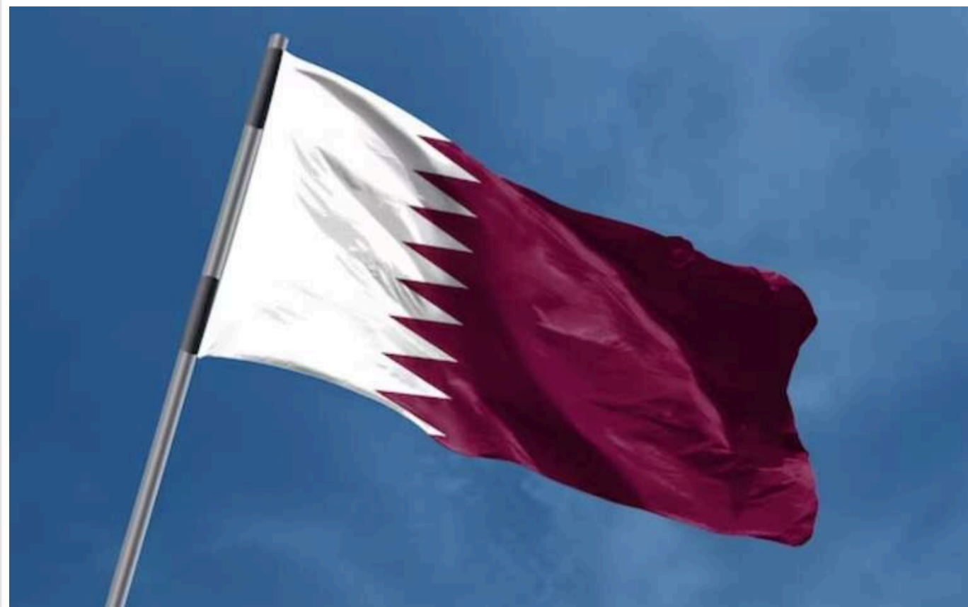
Катар відмовився виконувати роль посередника в переговорах про перемир'я в Секторі Гази і звільнення заручників

Катар також повідомив палестинський рух «ХАМАС» про необхідність перенести свій офіс з Дохи.