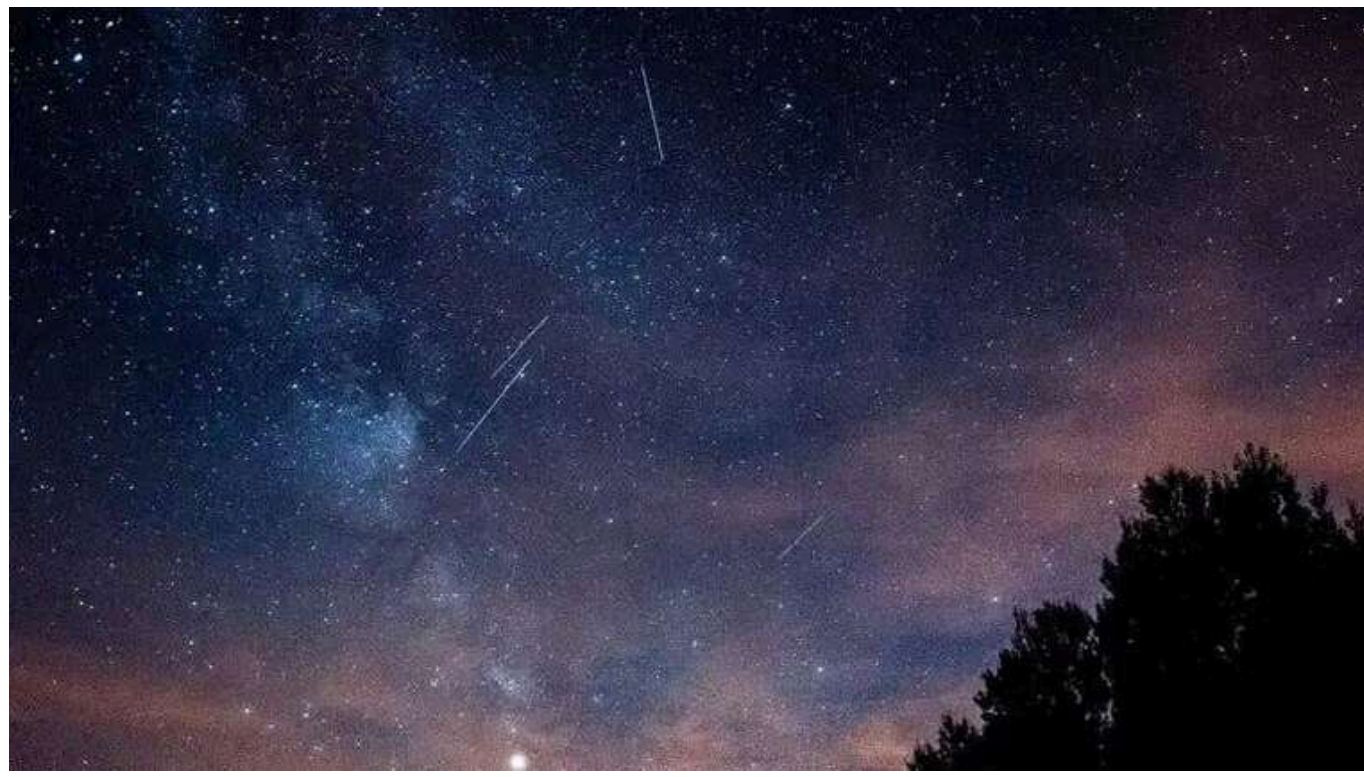
У листопаді на українців чекає один із найбільших зорепадів року, – EarthSky

У листопаді на жителів Землі чекає яскраве шоу – зорепад Леоніди.