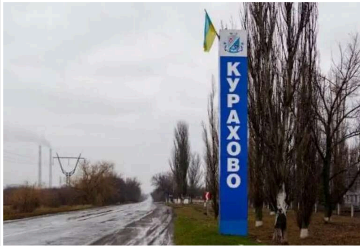
Forbes проаналізував положення Збройних сил України біля Курахового

Українські захисники, які обороняють Курахово, нещодавно успішно відбили одну з найпотужніших російських атак, завдавши ворогу значних втрат.