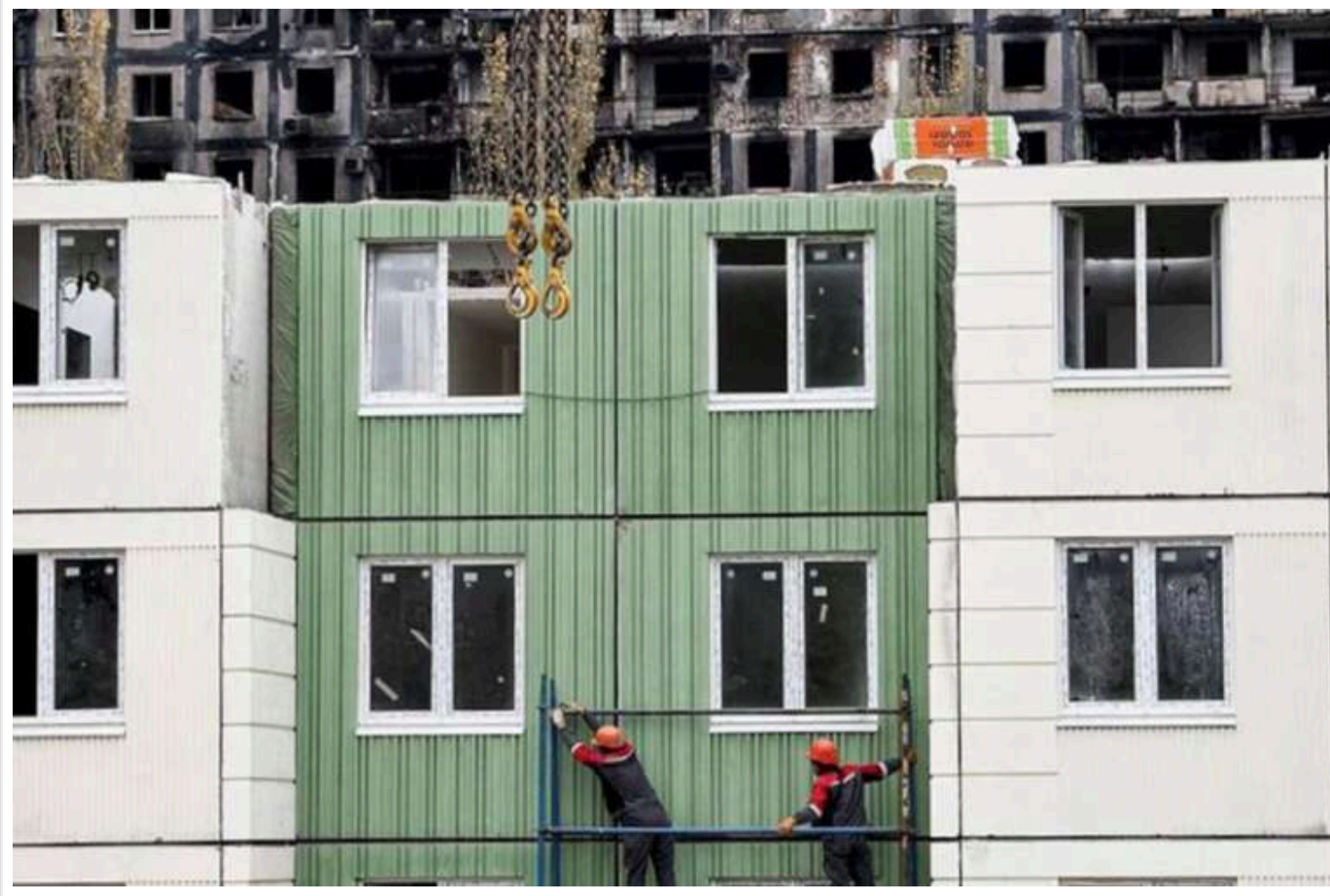
У захопленому Маріуполі окупанти передали ключі від квартири майже "місцевій жительці"

У Маріуполі російські окупанти вручили ключі від компенсаційної квартири «місцевій жительці». Однак з'ясувалося, що жінка не зовсім місцева.