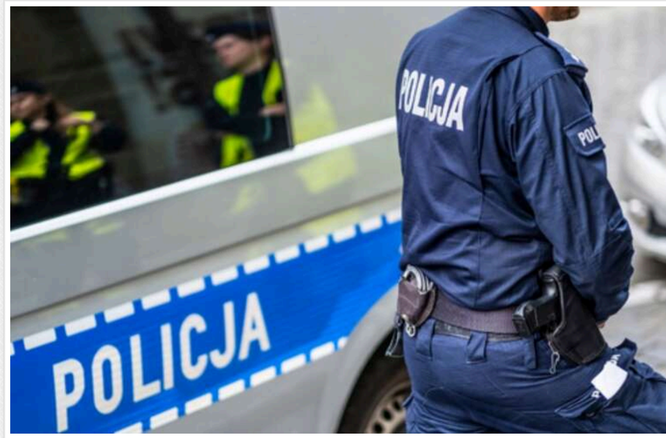
У Польщі поліцейський задушив українця під час затримання

У Польщі громадянин України загинув через надмірне застосування сили з боку місцевого поліцейського.